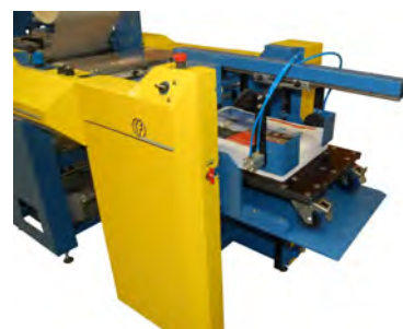
Stacker integrato opzionale